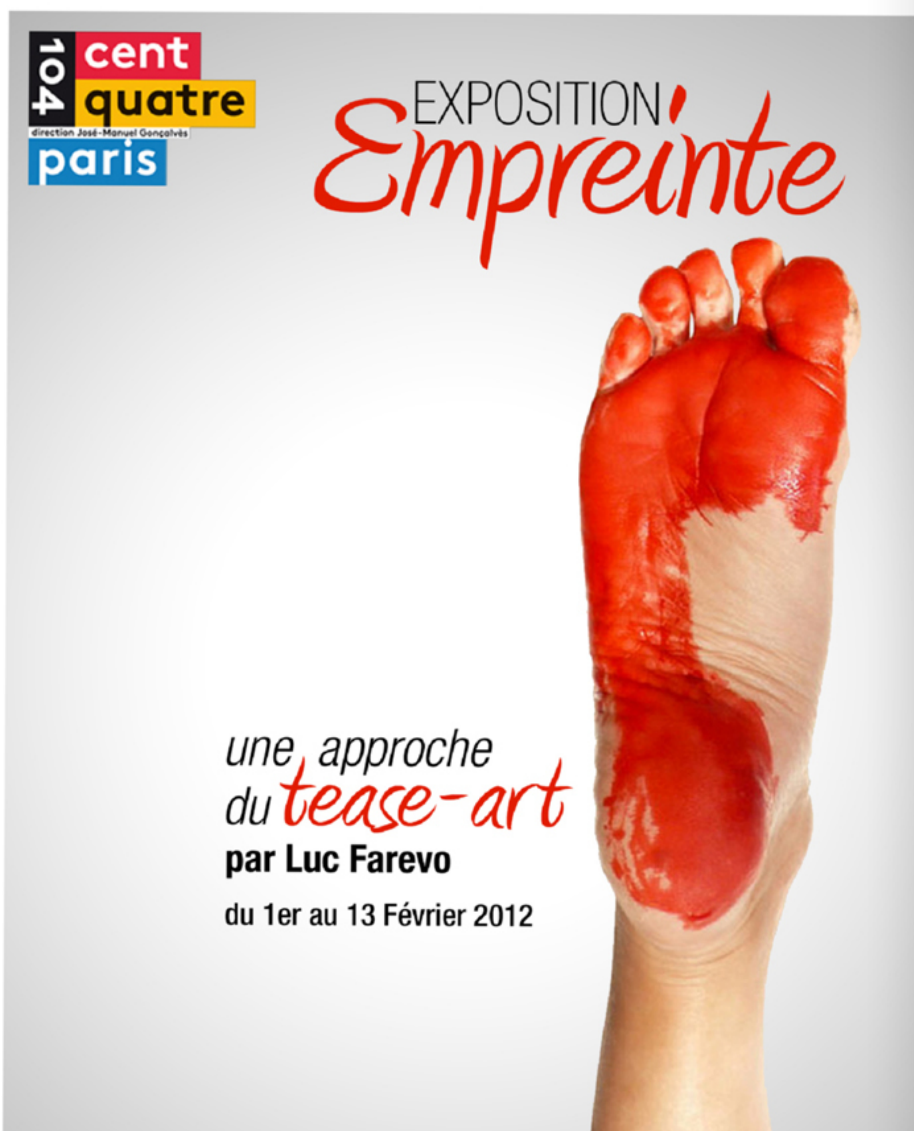
L'affiche de l'exposition, un simple indice sur son contenu.

Un art où la réaction du support est tout aussi importante que l'action du peintre