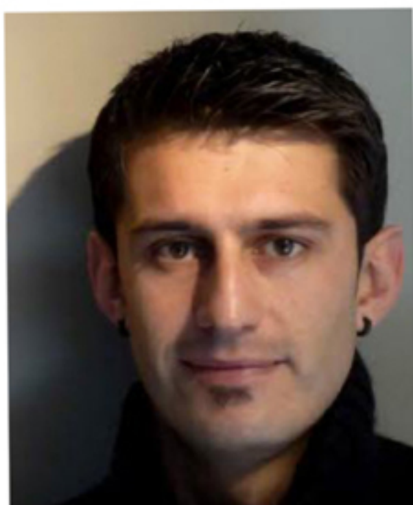
Photo prise pendant l'exposition