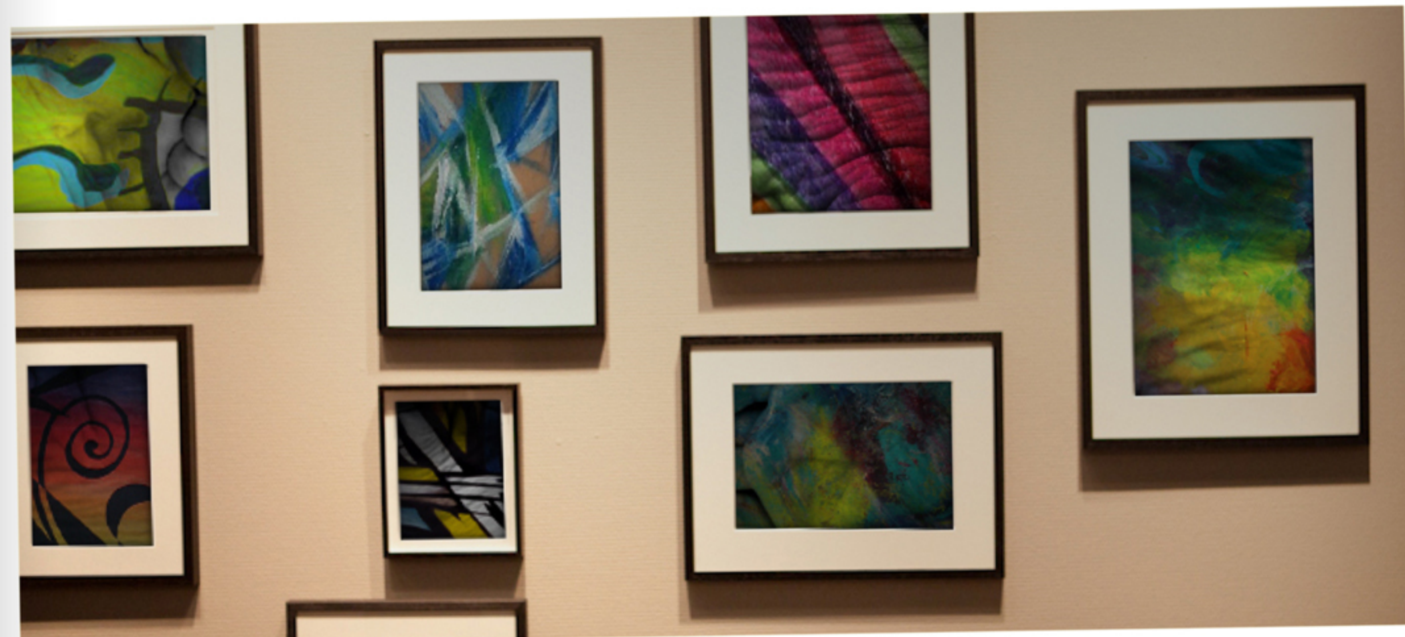
Une mise en espace, sur les murs, à la fois minimaliste et visuelle.

Sa méthode est, pour le moins, non conventionnelle. Chaque coup de peinture devient une action pour, tout autant, poser la couleur que chatouiller la demoiselle. De cette manière, et durant tout le processus de génération de l'œuvre, la